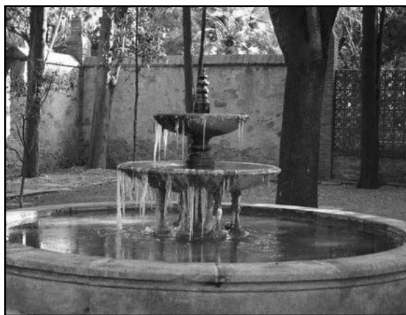
Els jardins de Martí-Codolar

Data: 4 de març (dissabte). Hora: De 9:30 a 13:30. Lloc: (Seminari Salesià Martí-Codolar) de. Avda. Vidal i Barraquer,1. Metro Montbau (Línia 3).